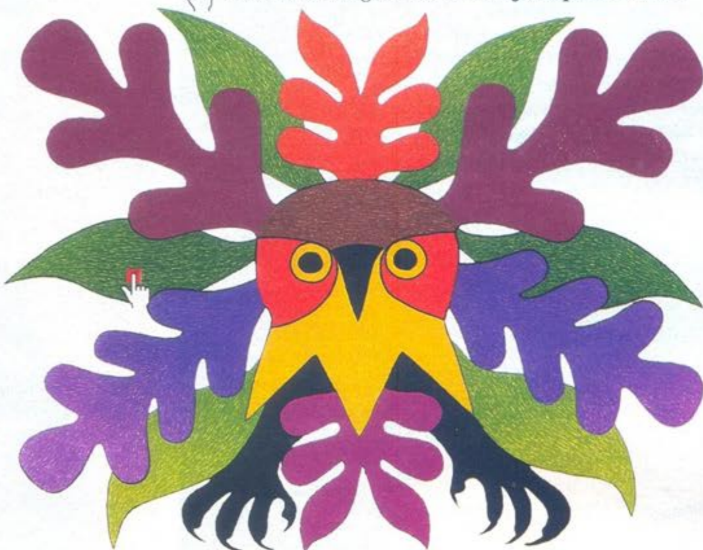
A litografia Coruja de Verão (1979), de Kenojuak: arte esquimó